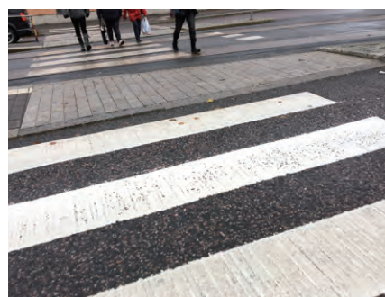
車椅子ユーザー・視覚障害者の双方が利用しやすい工夫

「Accessibility For All」「Culture For All」など「FOR ALL」と名のつく取組みが多くありました。まだ少ない状況ですが、街中には横断歩道から歩道に上がる場所に車椅子ユーザー向けのスロープ状の部分と視覚障害者向けに段差が確認できる部分がありました。障害者だけでなく、「すべての人のため…」として、より多くの人へのバリアフリーに向けた取組みと感じました。