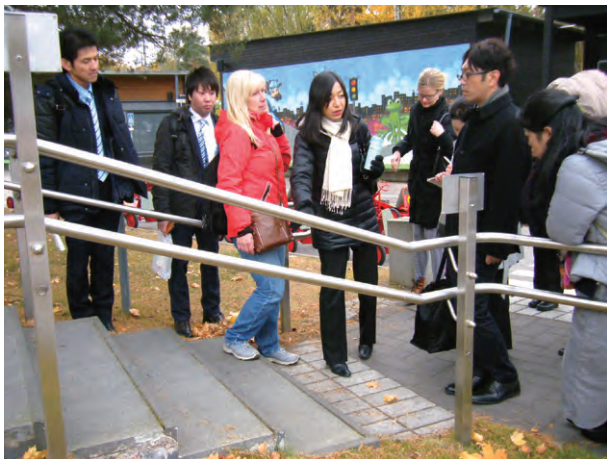
Esteri(エステリ ヘルシンキ市のアクセシビリティ施策でバリアフリーの研究・教育を行う)