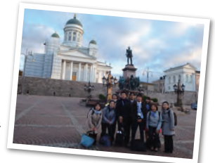
ヘルシンキ大聖堂の前で団員と一緒に