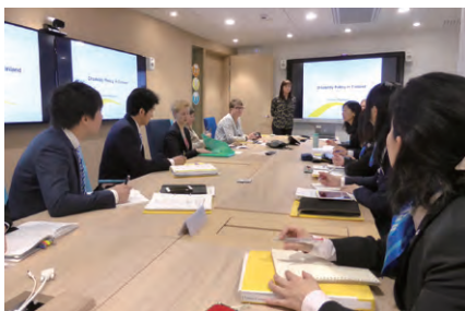
社会保健省でフィンランドの障害者施策の概要説明