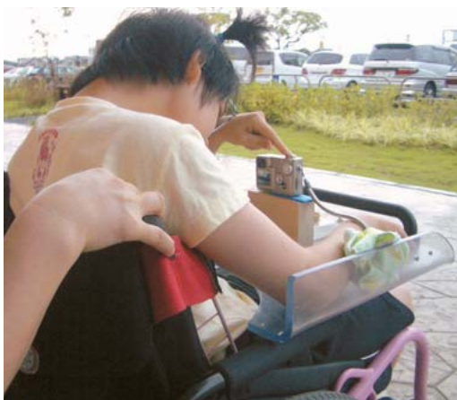
デジカメによる撮影の様子